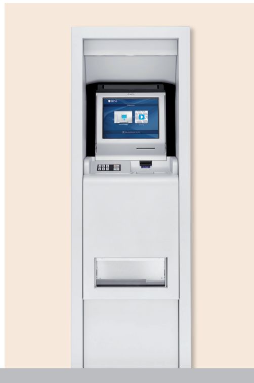
HESS CoinIn 325 Wandeinbaugerät