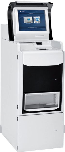
HESS CoinIn 315 Lobbygerät