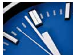
Service rund um die Uhr