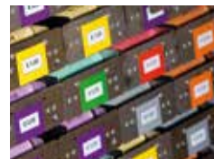
Flexibler Rollenmix – höchster Investi- tionsschutz