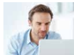
Administration und Überwachung in Echtzeit