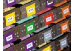
Flexibler Rollenmix – höchster Investi- tionsschutz