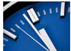
Service rund um die Uhr